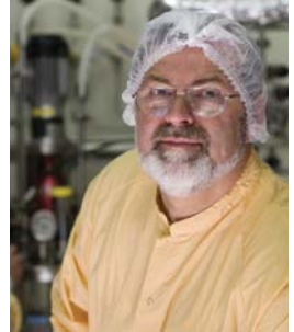
Im Forschungs- und Entwicklungszentrum von Baxter in Orth, Österreich, bringen die Mitarbeiter neueste wissenschaftliche Erkenntnisse in der Entwicklung biopharmazeutischer Produkte zur Anwendung.

Ausgleich zwischen Arbeit und Privatleben: Der Ausgleich zwischen Arbeit und Privatleben bildet einen wichtigen Aspekt des Mitarbeiterengagements bei Baxter. Das Unternehmen bietet an bestimmten Orten verschiedene Programme an, wie unter anderem Alternativen bei Arbeitsvereinbarungen, Managementleistungen zur Unterstützung älterer Arbeitnehmer und Kinderbetreuungsmöglichkeiten.